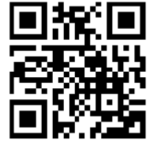
事前登録用二次元コード